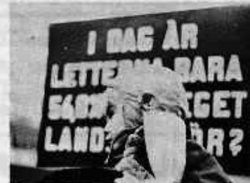
Cilvēku tiesību dienas demonstrācija 9.dec. Ieradījās maz cilvēku. Vai šim mazajam latvietim ir nākotne kā latvietim?

Televīzijas filmas uzņemtā "Dalle" (?), visi vīpešu uzraksti bija krieviski) par tautas deju un dziesmu motīviem iesākās interesanti: it kā paklausot diriģentam, kas pakāpies kalnā, mospilētā sanākusi pūtāju orķestra dalībnieki pāta, taurēja un spēlēja ielās, māju pagalmos un ārā uz kāpnēm. Bet jau ar maitēgu ansambli, kas Ventas krastā dzied "Līgodama upe nesa", filma iegrīma salkani sentimentālā ilustratīvismā. Latviešu tautas deju demonstrējumi Brīvdabas mūzeja pagalmos un pilsētu laukumos noveda pie viena kopsauciena: ne Kurses, ne Vidzemes sēktai nepiestāv dimanta