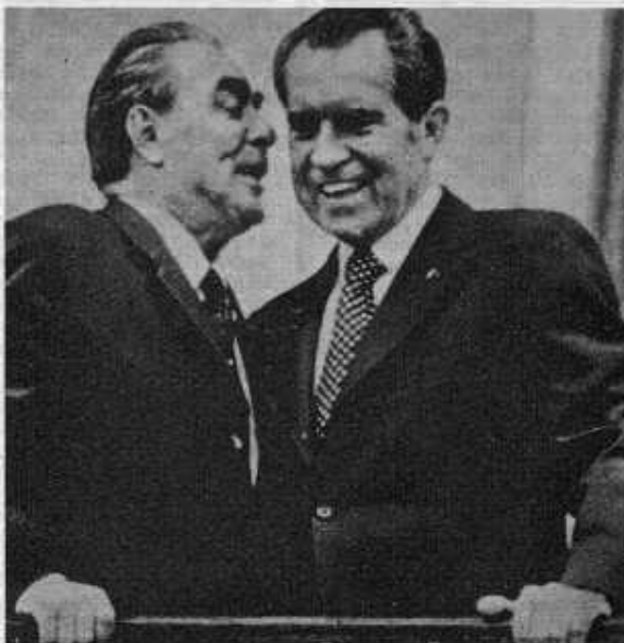
"Mēs jaunu pasauli sev celšim..."

Iesūr gandrīz visi, ar kuriem runāju, ļoti kritizēja ASV stāju, kas šķēvē izturoties pasīvi. Rodoties iespāids, itkā Nīksons būtu jau vienojies ar Brežņevu agrākajās sarunās arī par to, kas lemjams šķēvēs konferences un amerikāņi nevēloties radīt krieviem nekādas jaunās "grūtības". Mani sarunu biedri bažījās, ka ASV varētu nā - kamā gadā pēc Tuvo austrumu kara likvidēšanas sākt šķēvē izdarīt lielu spiedienu uz Eiropas valstīm, lai tās piekāpjas krieviem un pieņem kādu vispārējos vārdos izteiktu un krieviem pieņemamu vie - nosēnas cilvēku, ideju un informācijas apmaiņas jautājumā... Šīs sarunās noskaidrojās labvēlīgāka noskaņa pret memorāndu, nekā tas bija Helsinku konferences laikā. Eiropas dažādo zemju sociāldemokrātu pārstāvji, ar kuriem runāju, paskaidroja, ka memorāndā izteiktās prasības atbilstot viņu ieskatiem un solīja tās atbalstīt. Skandināvi tāda, ka viņu valdības jau esot devušas līdzīgas instrukcijas savām delegācijām šķēvē.